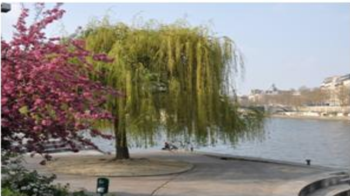
Tino Rossi au printemps

Donnant directement sur la Seine, le jardin Tino Rossi est un petit coin très prisé des étudiants du quartier qui aiment y organiser des pique-niques le midi et des apéros dinatoires en fin de journée. Les marches en pierre du jardin sont donc prises d'assaut les doux soirs d'été, et il n'est pas rare que guitaristes et autres musiciens de rue s'y installent pour jouer quelques accords. Du jardin on peut apercevoir l' île Saint Louis sur la gauche et le quartier de Bercy sur la droite. Outre sa position idéale près du fleuve, ce jardin a la spécificité d'être doté de plusieurs sculptures et statues qui trônent de part et d'autres en plein air, semblant se balader avec les passants.