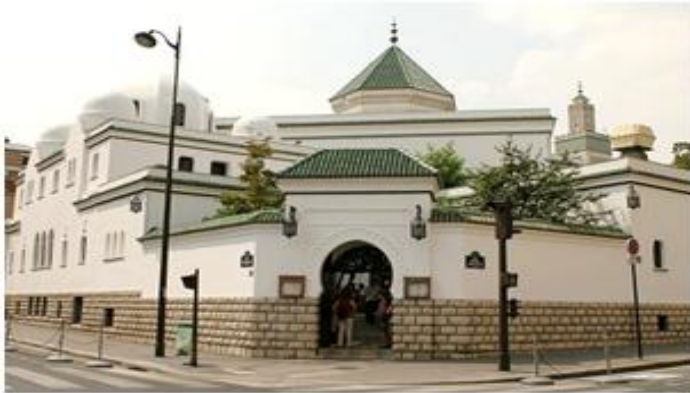
Entrée de la Grande Mosquée

A ne pas manquer : les pâtisseries orientales et le traditionnel thé à la menthe !