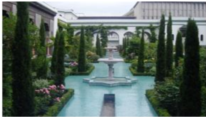
Cour de la Grande Mosquée