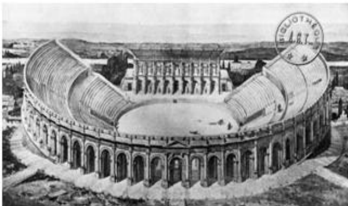
Les arènes, 2000 ans auparavant

Pas simple d'imaginer qu'il y a 2 000 ans, un immense amphithéâtre gallo-romain trônait à cet emplacement. Là où aujourd'hui il n'y a plus que quelques gradins entre lesquels la nature reprend peu à peu ses droits, se dressait à l'époque une arène de grande ampleur où les gladiateurs s'affrontaient féroceement pour divertir le peuple. L'arène comportait également une scène pour les représentations théâtrales. L'endroit est aujourd'hui idéal pour profiter du soleil ou pique-niquer entre amis.