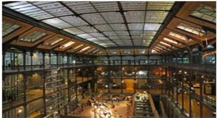
Muséum d'Histoire Naturelle