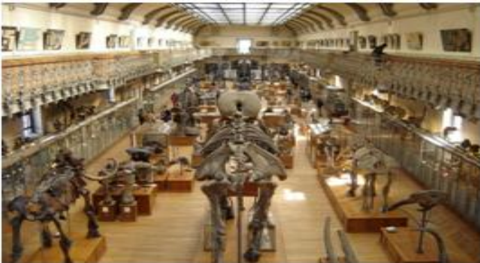
Grande galerie de l'évolution

Bon à savoir : comme tout musée, l'entrée est gratuite pour les moins de 26 ans.