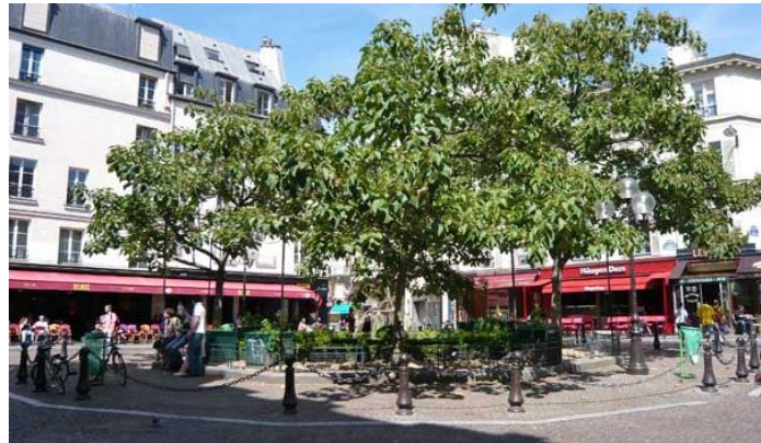
Place de la Contrescarpe

7 Tournez à droite dans la rue Lacépède, puis à gauche dans la rue de Navarre : l'entrée des ARENES DE LUTECE se trouve à quelques pas plus loin, sur votre droite.