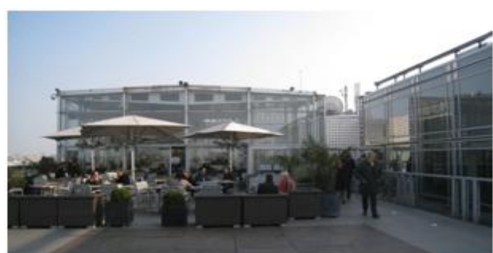
Terrasse au sommet