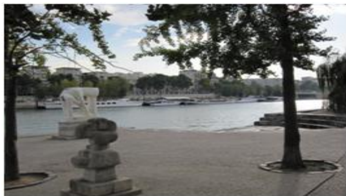
Sculptures en plein air