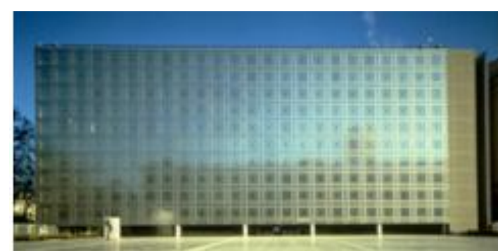
Façade de l'Institut

Si vous voulez voir ce qui se cache à l'intérieur du bâtiment, sachez que l'Institut abrite un grand musée s'étendant sur trois niveaux et qui raconte les transformations que la civilisation arabe a connues depuis la préhistoire. Ce magnifique musée détient une impressionnante collection d'objets antiques qui vous feront découvrir l'ancienne cité de Carthage, mais aussi les grands savants arabes du Moyen-Âge et les tapis subtilement tissés qui décoraient les palais du Maghreb et de l'Inde. Vous pourrez terminer la visite en allant faire un tour sur la terrasse située au dernier étage de l'Institut. Surplombant la ville, elle offre une vue impressionnante à ne pas rater.