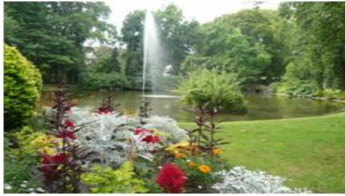
Jardin des Plantes