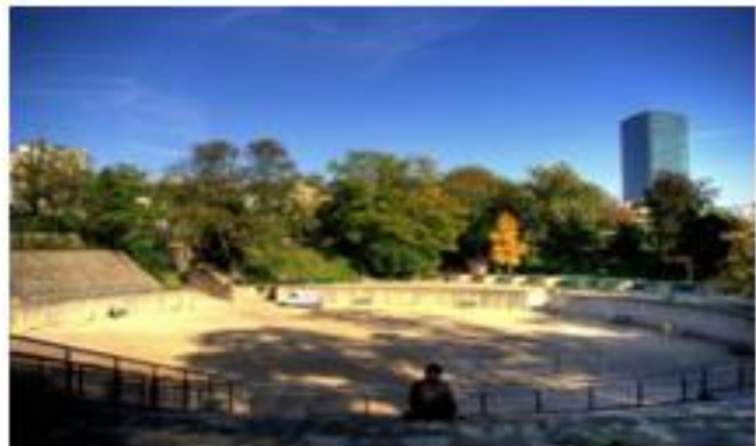
Les gradins aujourd'hui