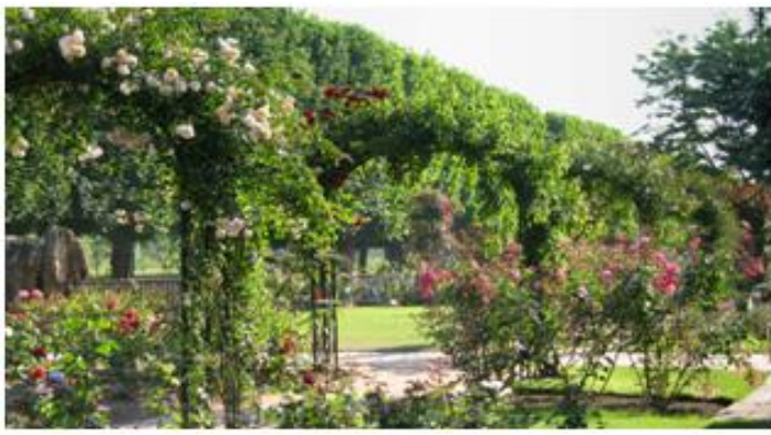
Roseaie du Jardin