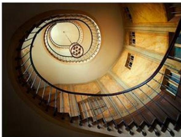
Escalier menant à l'ancien appartement de Vidocq