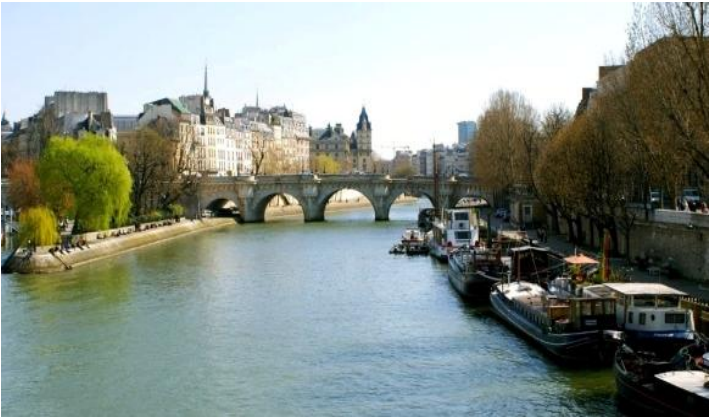
Vue du Pont Neuf

Construit au début du 17 ème siècle, le Pont Neuf est le plus ancien des ponts parisiens. Orné de ses 381 visages grimaçants, pourvu de trottoirs afin de protéger les piétons de la boue et des chevaux et vide de toute habitation et commerce, ce pont constituait à l'époque une grande nouveauté et a gardé le nom qui lui avait été spontanément attribué à l'époque. Il est par ailleurs le premier pont de pierre de Paris à traverser entièrement la Seine et à être découvert. En traversant le pont, vous vous éloignez de l'Île de la Cité pour passer de l'autre côté du fleuve, sur la rive gauche de Paris.