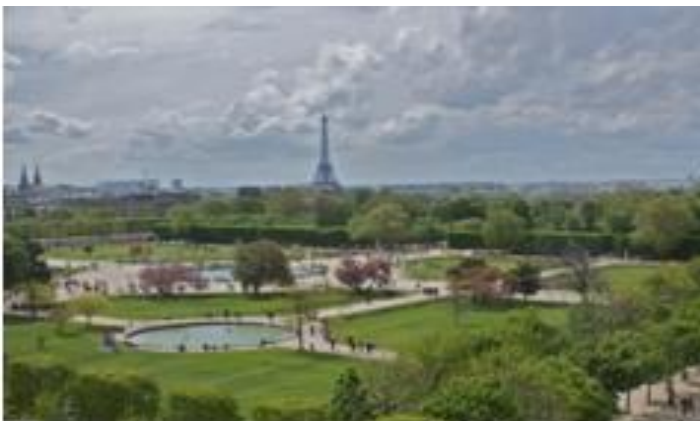
Jardin des Tuileries

Le jardin des Tuileries tient son nom du fait que son emplacement était occupé auparavant par des fabriques de tuiles. Sur une superficie de 25 hectares, l'endroit abrite aujourd'hui le plus grand jardin à la française de la ville. Il entourait autrefois le palais des Tuileries, aujourd'hui disparu, qui constituait la demeure du roi. De la place du Carrousel, le Jardin des Tuileries s'étend, sur une longueur de près d'un kilomètre, jusqu'à la place de la Concorde, entre la rue de Rivoli et le quai des Tuileries. L'été, une partie du parc reste ouverte toute la nuit et nombreux sont les pique-niqueurs et promeneurs aguerris qui en profitent pour rester jusque tard dans la nuit. Si vous voulez déjeuner sur le pouce entre amis, le jardin dispose de plusieurs petits stands à sandwichs disposés. Notez que pendant les mois de Juillet et Août, le jardin des Tuileries accueille une fête foraine traditionnelle et familiale, la « fête des tuileries ».