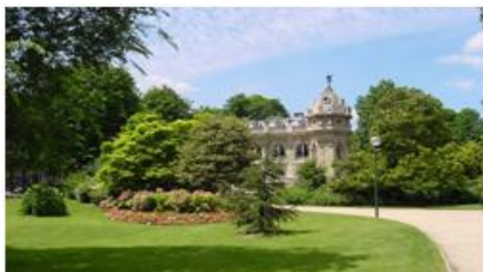
Jardin des Champs-Élysées