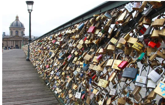
Cadenas des amoureux