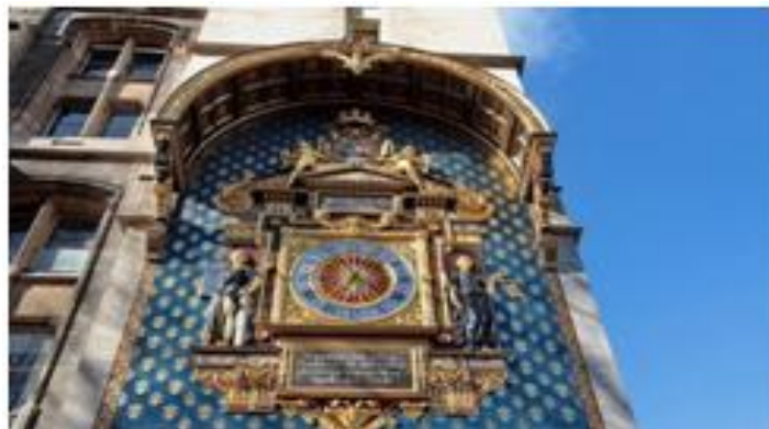
La Tour de l'Horloge

Témoin des plus grands événements de l'Histoire de France, la Conciergerie – également appelé Palais de la Cité – était le siège du pouvoir des rois de France depuis le 10 ème siècle, puis servit de résidence royale jusqu'au 14 ème siècle. Longeant le quai de l'Horloge, le palais était autrefois plus grand et s'étendait jusqu'à l'actuel Palais de justice de Paris. C'est lors de la Révolution Française que le lieu devint le triste symbole des violences perpétrées à cette période : les prisons révolutionnaires y furent établies et la reine Marie-Antoinette, entre autres, y fut emprisonnée avant son exécution publique. Antichambre de la mort pendant la Terreur, la prison de la Conciergerie laissait sortir libres peu de prisonniers. Elle occupait le rez-de-chaussée du bâtiment et les deux tours. L'étage supérieur était pour sa part réservé au Parlement. Passionnante, la visite de la Conciergerie est un incontournable pour les férus d'Histoire.