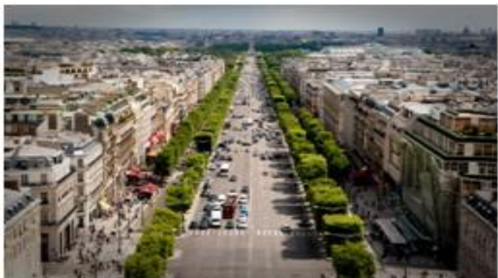
L'avenue des Champs-Élysées

Les Champs-Élysées tirent leur nom mystique du lieu des Enfers où séjournent les âmes pures, dans la mythologie grecque. Figurant parmi les principaux lieux touristiques de la ville, l'avenue s'étend sur près de 2 km, de la place de la Concorde à la place Charles-de-Gaulle. Dans sa partie inférieure, à l'est du rond-point des Champs-Élysées-Marcel-Dassault, l'avenue se transforme en « Promenade des Champs-Élysées », qui longe le jardin de l'avenue sur 700 mètres. Étonnamment, le jardin n'a pas changé d'aspect depuis 1840, et offre de jolies surprises aux promeneurs. Les statues, fontaines et kiosques à musique côtoient les magnifiques musées du Grand Palais , du Petit Palais et du Palais de la Découverte , les salles de spectacles pour enfants et les restaurants dans lesquelles ont travaillé de grands noms de la cuisine française. Les arbres et les parterres fleuris donnent quant à eux lieu à de belles promenades tout au long de l'année.