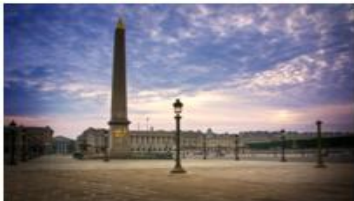
Obélisque du Louxor

En 1839, le roi Louis Philippe souhaite réaménager la place et ordonne la construction de deux superbes fontaines et de statues représentant les huit plus grandes villes de France de l'époque : Bordeaux, Brest, Lille, Lyon, Marseille, Nantes, Rouen et Strasbourg. Des colonnes rostrales y sont également installées ainsi qu'un obélisque autrefois érigé devant le temple de Louxor et offert par le vice-roi d'Egypte, Méhémet Ali, au roi Charles X en signe de bonne entente. La Place de la Concorde donne sur le bord de la Seine mais est fermée sur son côté nord par l'hôtel de la Marine, l'hôtel Crillon, l'église Madeleine et le palais Bourbon.