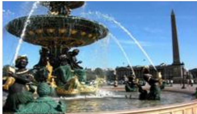
Une des deux fontaines de la place