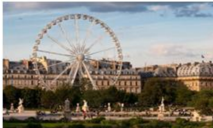
Fête foraine aux Tuileries