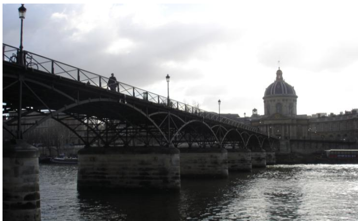
Pont des Arts

Tour à tour lieu d'exposition et d'inspiration de peintres et photographe, de rencontres amoureuses et de pique-niques entre amis pendant l'été, le Pont des Arts ne ressemble à aucun autre sur Paris. Il tire également sa spécificité de ses balustrades grillagées et complètement recouvertes de « cadenas d'amour » accrochés ici par des couples du monde entier. Ces cadenas portent les initiales gravées ou écrites au marqueur indélébile des deux amoureux en question mentionnant leurs prénoms ou initiales ainsi que la date à laquelle le cadenas et leur amour ont été scellés. Initialement apparue sur le Pont des Arts en 2008, cette tradition s'est peu à peu étendue à la Passerelle Léopold-Sédar-Senghor, au Pont de l'Archevêché et à la Passerelle Simone-de-Beauvoir. Certains décrient cette pratique, le poids des centaines de cadenas nuisant à la préservation du pont. A terme, les parapets risquent effectivement de tomber sur les péniches.