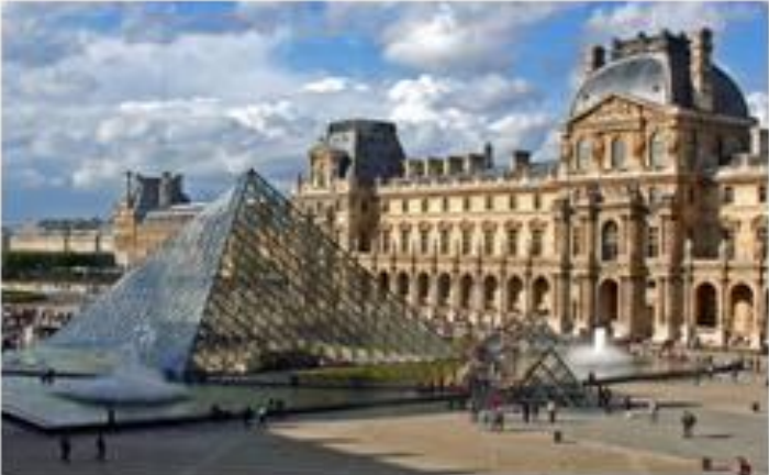
Pyramide du Louvre